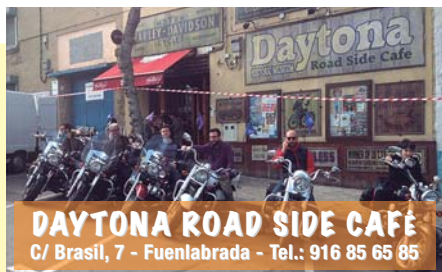
DAYTONA ROAD SIDE CAFE C/ Brasil, 7 - Fuenlabrada - Tel.: 916 85 65 85

En la localidad madrileña de Fuenlabrada puedes disfrutar del ambiente más motero, con especial atención al mundo del custom, en el espectacular bar Daytona.