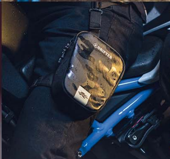
DR03 → BOLSA DE PIERNA