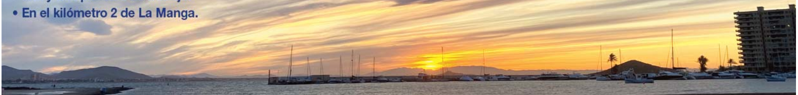
PUESTA DE SOL DESDE LA TERRAZA DEL APARTAMENTO