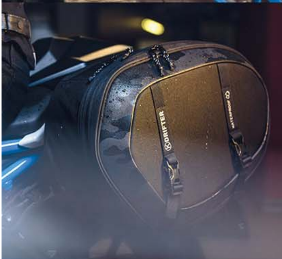
DR05 → BOLSAS LATERALES