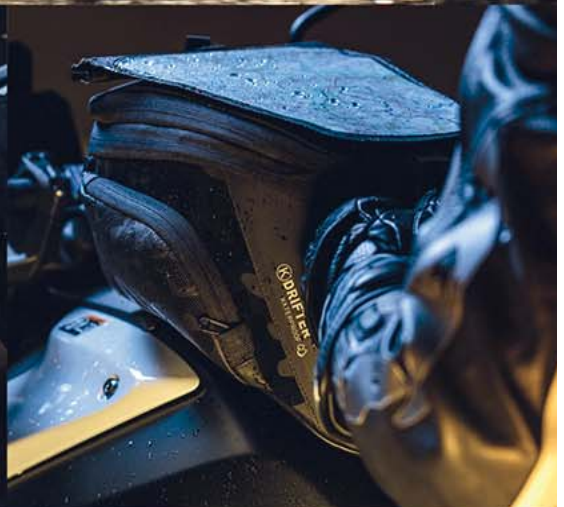
DR01 → BOLSA DEPÓSITO